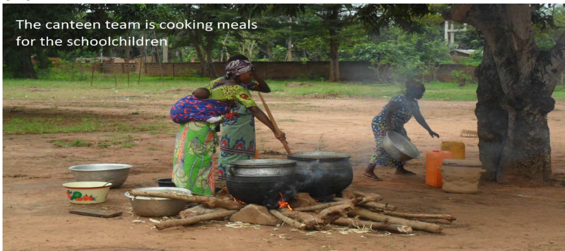
Femmes préparant pour la cantine des écoliers de Kpodaha

Pour soutenir les élèves en classe d'examen, avec le concours de la fondation américaine Globalgiving et les amis du Professeur Lisa, l'ONG ED a rapidement instauré la cantine pour un temps. Cette grande école n'en a pas. Ailleurs, les écoles qui ne sont pas de complexes scolaires en ont.