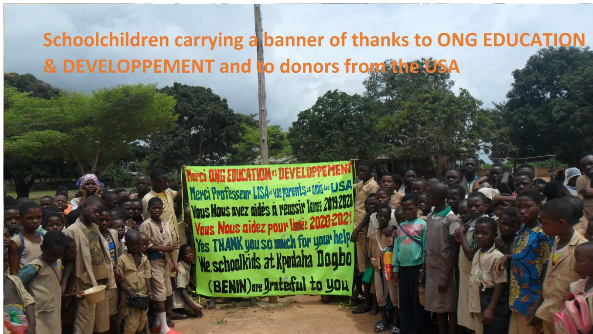
Ecoliers de Kpodaha remerciant les généreux donateurs Américains