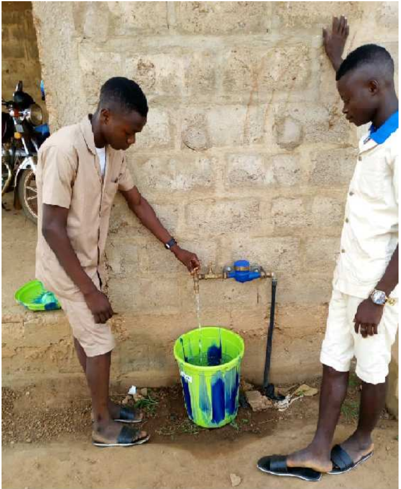
Water supplied by ONG EDUCATION ET DEVELOPPEMENT to Kpodaha CEG