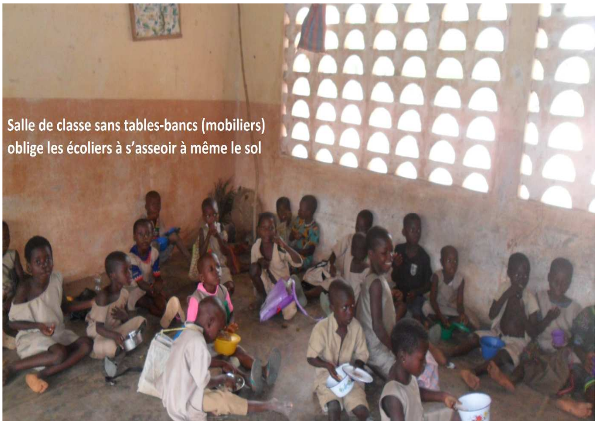
Salle de classe sans tables-bancs (mobiliers) oblige les écoliers à s'asseoir à même le sol