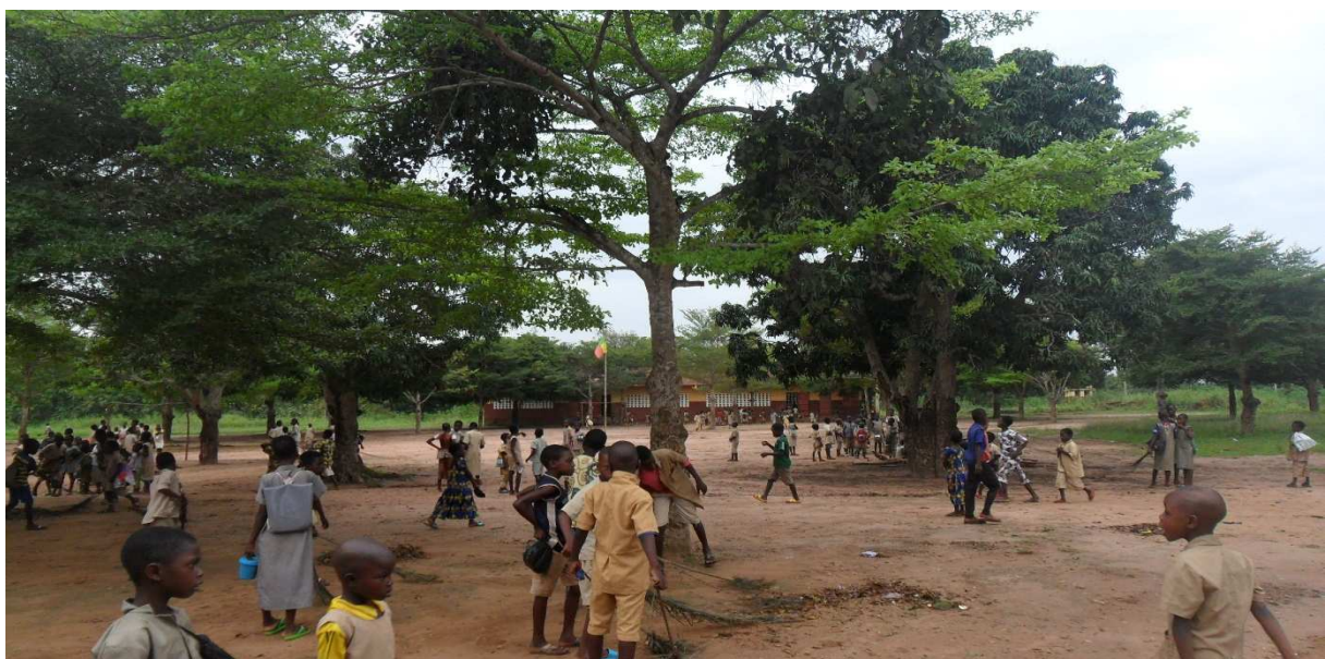
Ecoliers dans la cour de l'école

Au complexe scolaire public de Kpodaha, il y a 681 écoliers qui sont concernés et qui ont bénéficié de l'aide de l'ONG ED.