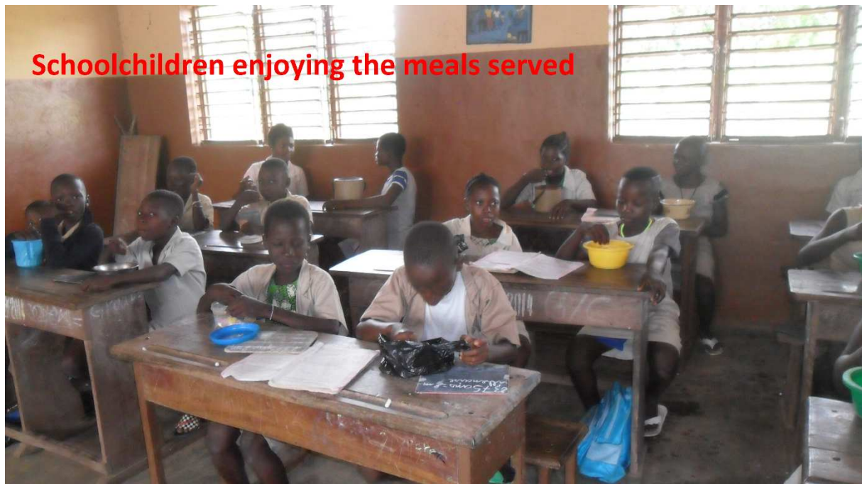
Schoolchildren enjoying the meals served