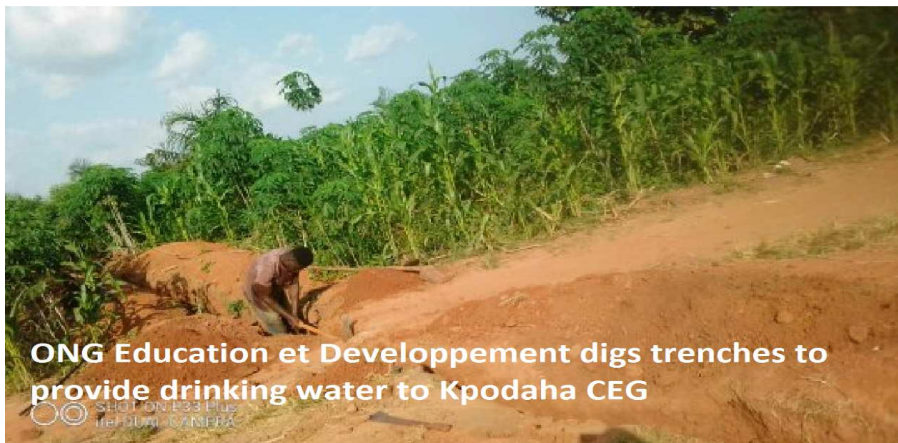
Tranchée creusée pour fournir de l'eau potable au collège