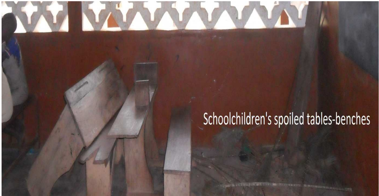
Une partie de tables-bancs gâtés au complexe scolaire public