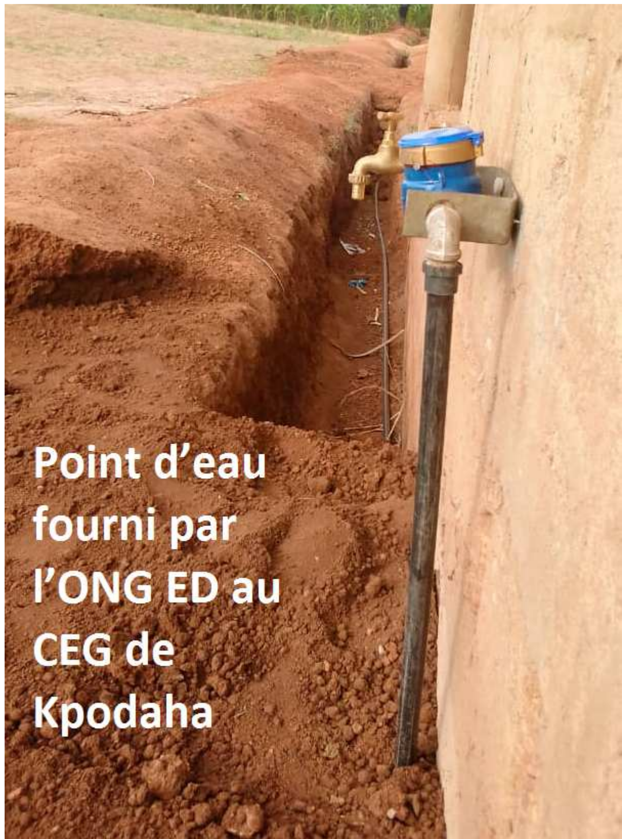
Robinet d'eau installé au CEG de Kpodaha