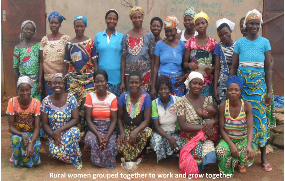
Rural women grouped together to work and grow together