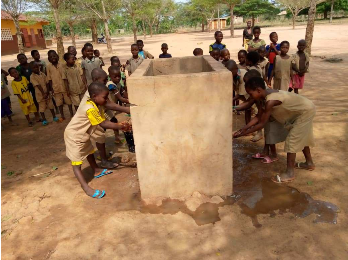
Ecoliers se lavant les mains