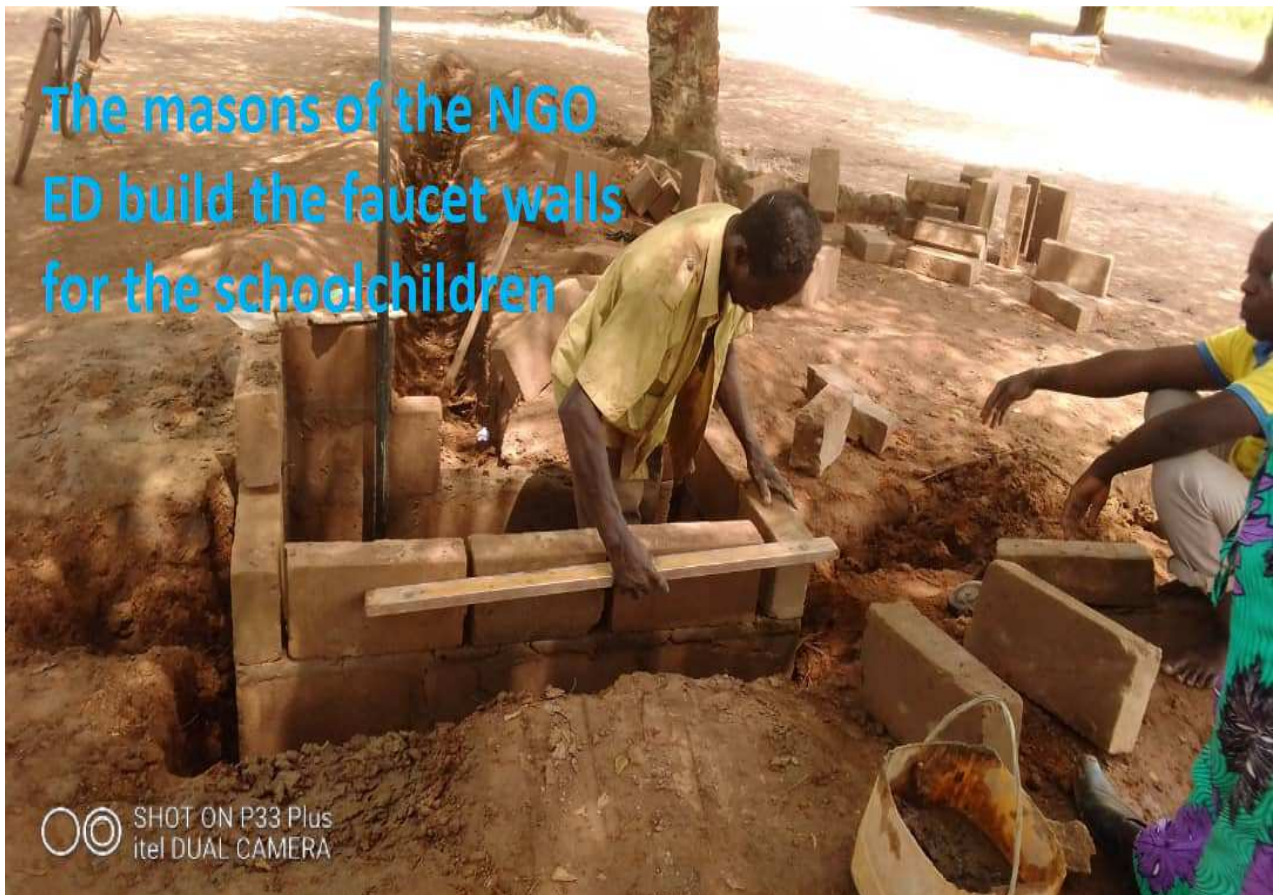
ONG EDUCATION ET DEVELOPPEMENT has a long trench dug to drain drinking water at the public school complex in Kpodaha

The masons of the NGO ED build the faucet walls for the schoolchildren