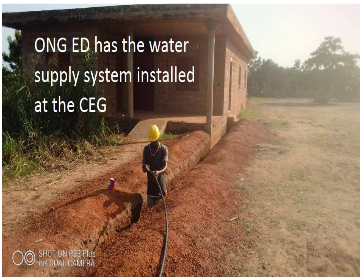
Plombier installant les tuyaux d'eau