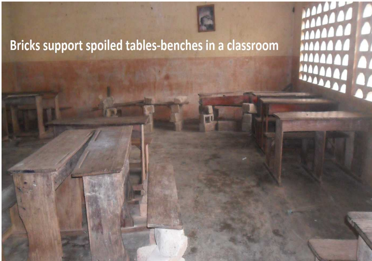
Une classe où des tables-bancs gâtés sont soutenus par des briques