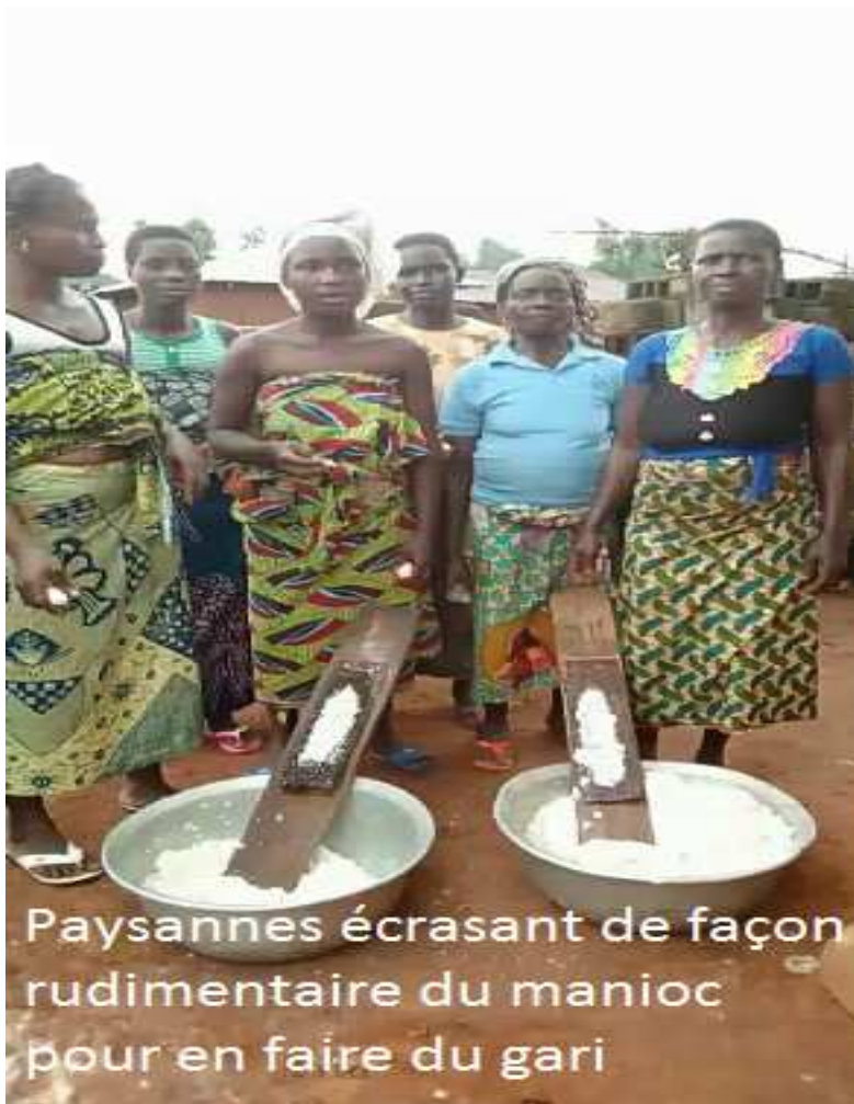
Paysannes écrasant de façon rudimentaire du manioc pour en faire du gari