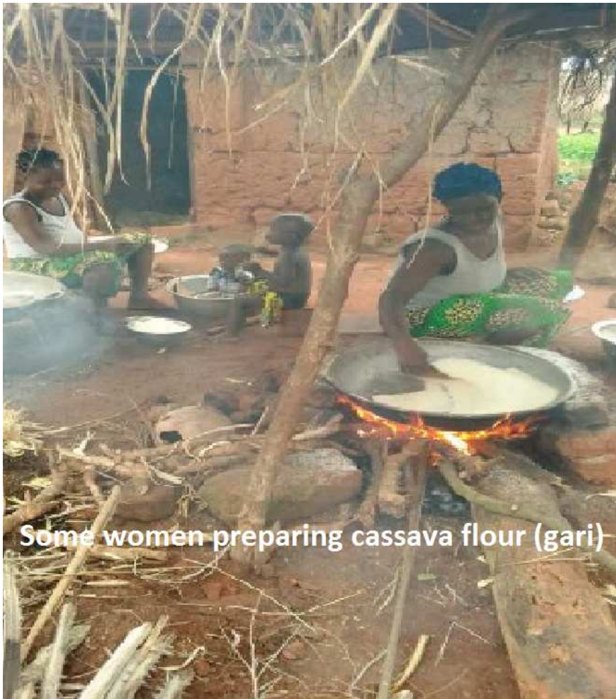
Some women preparing cassava flour (gari)