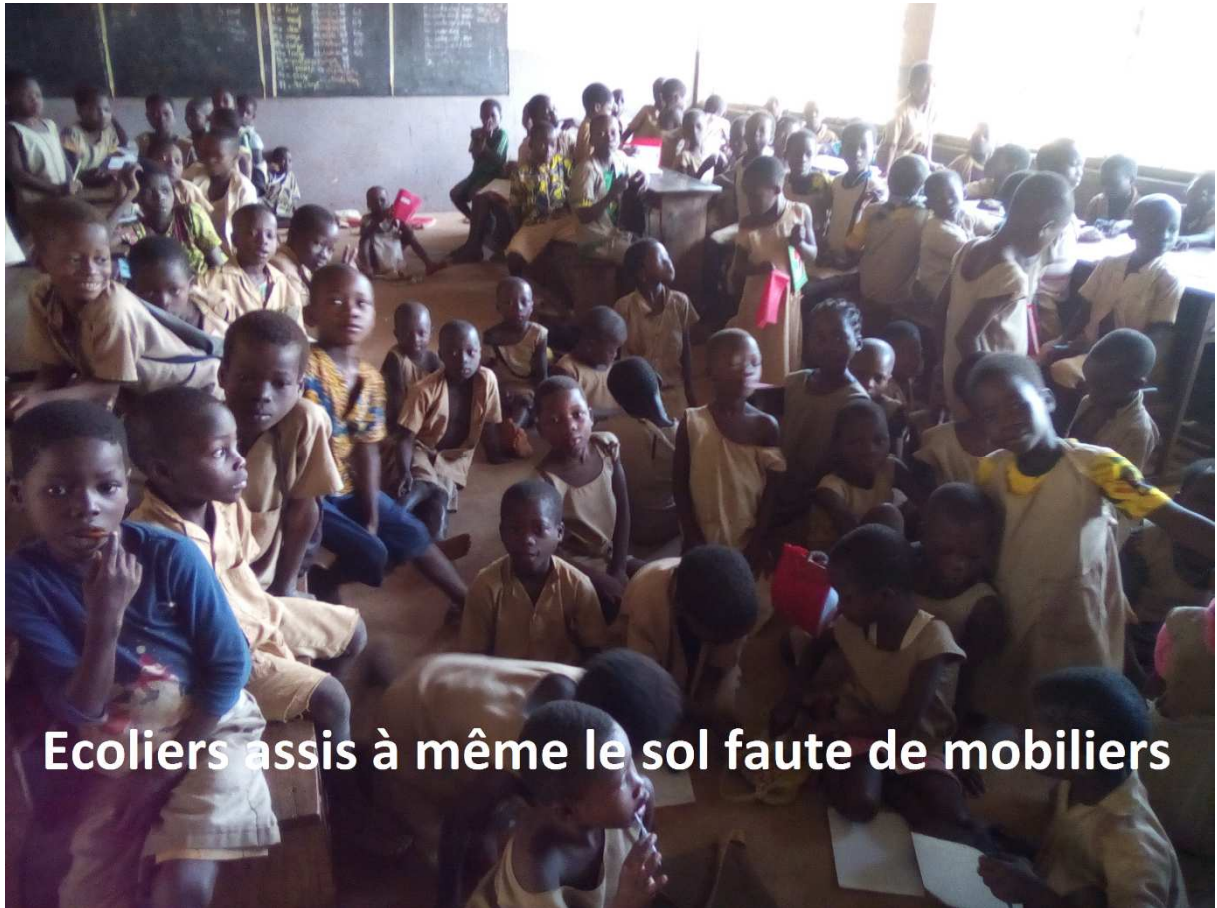
Ecoliers assis à même le sol faute de mobiliers