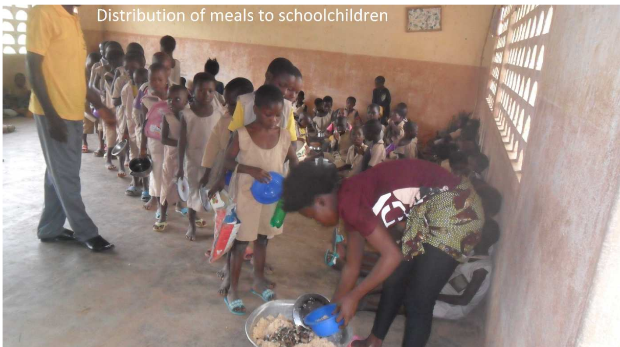
Distribution de mets aux écoliers