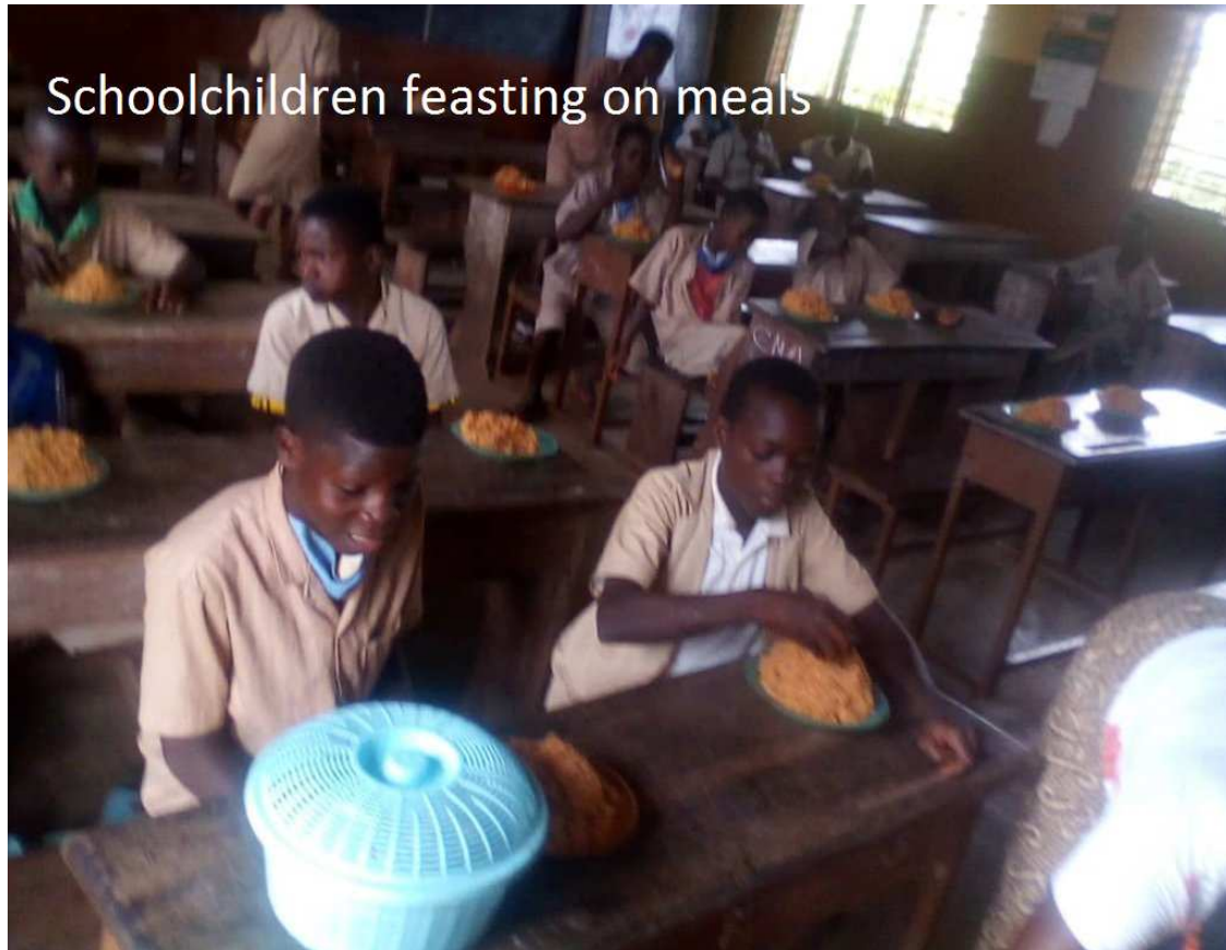
Schoolchildren feasting on meals